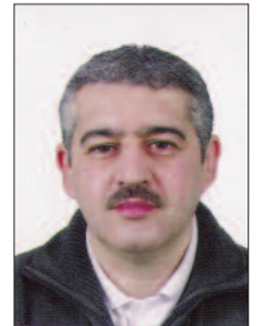
■ حامد حمور

هل سيكون رياض محرز في كامل قدراته الفنية والبدنية خلال نهائيات كأس إفريقيا للأمم في جوان القادم بمصر؟ ذلك هو السؤال الذي يطرحه الجمهور الجزائري بإلحاح كبير هذه الأيام بعد أن ساءت وضعية «صاحب اليسرى السحرية» في ناديه مانشيستر سيتي، حيث أصبح خارج حسابات المدرب غوارديولا ولازم مقعد الاحتياط لفترة طويلة. فبعد أن قام بمجهودات معتبرة وقدم