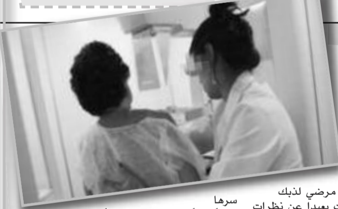
سرها إلى أبي لأنها تحولت من المرأة الكاملة إلى واحدة ناقصة تعد أيامها لتموت».