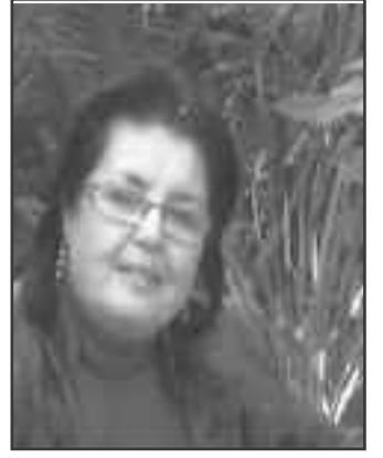
بقلم الدكتورة: وريدة دالي خيلية كلية الإعلام والاتصال جامعة الجزائر 3