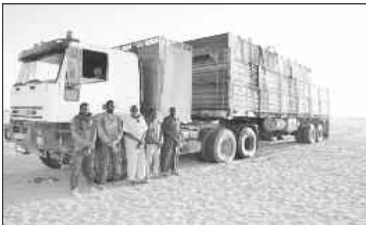
(15) قنطارا من ذات المادة.