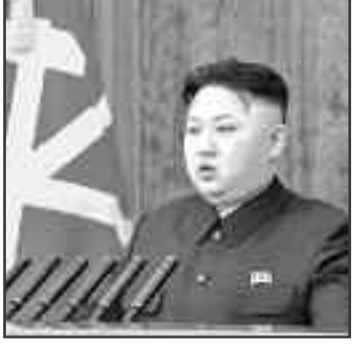
في تحقيق هدف نزع السلاح النووي.

قال مكتب زعيم كوريا الشمالية كيم جونغ أون أمس، إنه تعهد خلال القمة التي جمعته مع رئيس كوريا الجنوبية مون جاي إن بإغلاق موقع التجارب النووية في بلاده في ماي المقبل، وأعلنت كوريا الجنوبية أن كيم وعد بدعوة خبراء أمريكيين وصحفيين للتحقق من إغلاق الموقع.