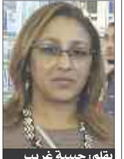
بقلم: حبيبة غريب

غالبا ما يقترن الإعلام بالثقافة، كون الكتابة الصحفية أو الخبر المصوّر أو المذاع على أمواج الأثير يحتاج في حد ذاته لصناعته وتقديمه نوعا من الإبداع، سواء في الحرف