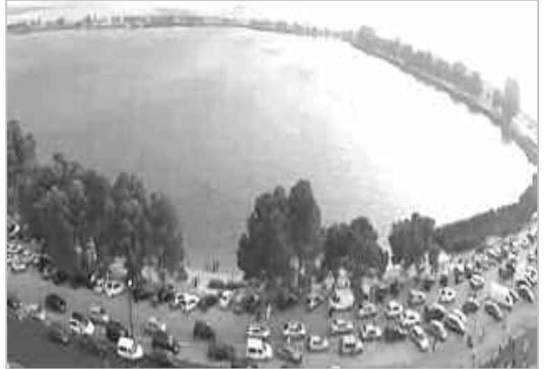
سيدي بلعباس: غ. شعدهو

دقت جمعيات ناشطة في مجال البيئة بسيدي بلعباس ناقوس الخطر بعد تدهور الوضع البيئي بحيرة سيدي محمد بن علي، وتراجع منسوب المياه بهذا الموقع الطبيعي الامر الذي بات يهدد جفاف هذا المسطح المائي واختفاء بؤادر الحياة البيولوجية به.