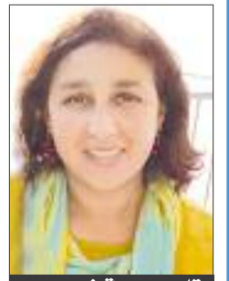
بِقلم: حبيبة غريب

كانت لـ«الشعب» جولة لقصبة الجزائر بمناسبة يومها الوطني، وفتت من خلالها على مواقع المحروسة ومعالمها ودورها وأثار الزمن والإهمال بالرغم من كل المحاولات لترميمها. فطرح السؤال نفسه ماذا عن واقع القصبات الأخرى؟ ولماذا لا تحظى هي الأخرى بقدر من الاهتمام وبعض مشاريع الترميم وإعادة التأهيل؟ أسئلة تستوقفنا لندق ناقوس الخطر