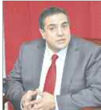
بمشاركة النخبة والأحزاب السياسية .

وشدد رئيس جبهة المستقبل على ضرورة إبعاد المؤسسة العسكرية عن العمل السياسي وعدم إقحام قوات الجيش في المتاهات السياسية مشيراً إلى ان دوره في الحفاظ على امن واستقرار الجزائر وشعبها، موضعا في