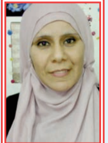
بقلم أمينة جبالله

سلامنا الحار إلى تلك الضئ التي ليست بالقليلة والمنتشرة عبر مختلف المناطق الداخلية للوطن منها السهبية والجبيلية، لاسيما الصحراوية أين تعيش مع أسرها في ظروف مناخية قاسية