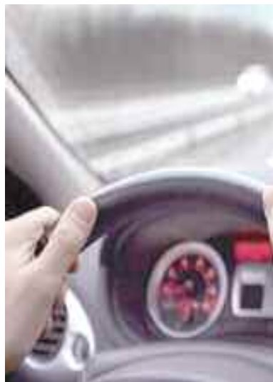
بقلم: د. وليد بوعديلة جامعة سكيكدة

منذ سنوات وأنا أدعو لتجسيد مشروع هام يساهم في تقريب الشرطة والدرك من المواطن، ومقاتلنا في الشبكة التكنولوجية تشهد، مقتنعين بأن المشروع يحقق بعضا من الأفكار التوعوية والتثقيفية والتحسيسية بتواعد المرور وحظر إرهاب الطرقات إلى خطر