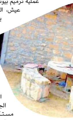
للشباب، شععاني على الفكرة وساعدوني على تجسيدها، لكن للأسف هناك بعض الأهالي لا يرحبون بها، فقد قاموا بهجر البيوت القديمة وبناء بيوت بالأجر والاسمنت وغيروا الطابع المعماري القديم، ودافعهم أن عملية الترميم تكلف كثيرا من المال.

ذلك سيتم تكريم الفائزين الثلاثة الأوائل في حفل خاص. وقد حدّد يوم 30 سبتمبر كآخر أجل لاستلام النصوص المشاركة، مع دعوة الراغبين في خوض غمار المسابقة التواصل مع مجموعة «ميلة تقرأ» على صفحتها بمواقع التواصل الاجتماعي. وأشار المتحدث إلى أنّ الطبعة الأولى من «أقلام ميلاف» كانت قد خصّصت لألوان أدبية مختلفة من شعر وخاطرة وقصة، وكانت بمثابة نسخة تجريبية لآقت استحسانا كبيرا من طرف الشباب المبدع تجاوز عدد المشاركات فيها 300 مشاركة من مختلف ولايات الوطن، لتليها الطبعة الثانية والتي تم تخصيصها للقصة القصيرة وكانت بالتعاون مع دار منشورات المتقف للنشر والتوزيع. وكشف نبيل في سياق حديثه أنّ مجموعة «ميلة تقرأ»، تتطلع من خلال مبادرة «مسابقة أقلام ميلاف الوطنية» إلى إيجاد أفق أوسع تسمح لها بإعطاء الفرصة لكل مبدع للبروز في جميع الأجناس الأدبية، وإعطاء قيمة مضافة للساحة الأدبية والثقافية الجزائرية ولم لا تصبح المشاركات فيها 300 مشاركة من مختلف ولايات الوطن، لتليها الطبعة الثانية والتي تم تخصيصها للقصة القصيرة وكانت بالتعاون مع دار منشورات المتقف للنشر والتوزيع.