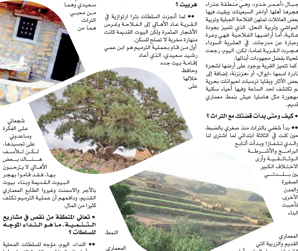
النمط المعماري القديم، ثم رمت بدوري بيت جدي وأبقيته على طابعه العمراني القديم وبدأ الأهالي في تقليدنا تدريجيا.

التنمية، ودافعهم أن عملية الترميم تكلف كثيرا من المال. النداء، اليوم، موجه للسلطات المحلية من أجل فك العزلة عن القرية التي تربطها بالمحيط الخارجي عن طريق غير معبدة بطول 4 كلم، ويصعب السير فيها، خلال الشتاء خاصة، كما نحن في حاجة إلى ربطنا بشبكة الكهرباء ومساعدة السكان على