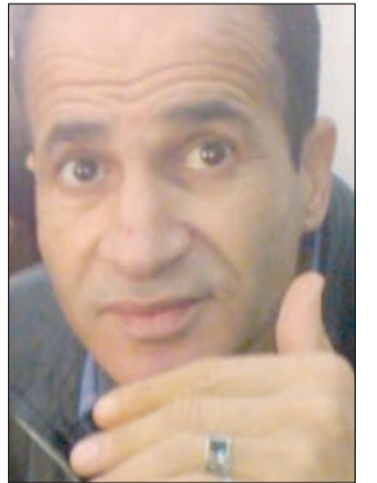
بقلم: جمال نصر الله شاعر صحفي

لا يحق لنا صراحة كأمة واعية بشؤون عصرها.. أن تجلب أدوات من الغرب (خاصة الأوروبية منها) ثم تحاول من خلالها أن تقلب بها علينا مقدساتنا التي ألفناها أو تم الإقتناع بها منذ قرون خاصة النص الديني... لأن هنالك أطراف كثيرة عندنا في الجزائر تحاول أن تقلد بعض الأسماء الغربية ممن هي تنتج لنا بعض المصطلحات التابعة ووليدة الحداثة المزعومة حتى لا نقول العبثية... كالإبستمولوجيا والسيموطيقا والميتا وغيرها من المعاول التي تصلح في بيئة دون أخرى بلا شك.. وتصلح لفرن أدبي وروائي ومقام دون آخر.. ثم تحاول استخدامها بل تعلن عن بدأ أعمالها في تراثنا وصولا إلى الدين نفسه... مخدشة بذلك مشاعر المليار وأزيد من المسلمين في العالم.