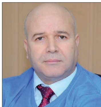
الداعية إلى تحقيق التغيير الشامل ورحيل بقايا النظام السابق».