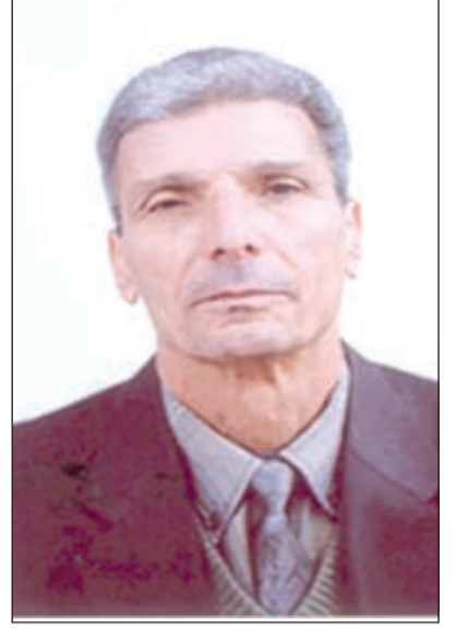
بقلم: الطاهر عرفه مفتش التربية سابقا

إلى ثلاث كيانات عام 1947 وبالتالي الاعتراف بإقامة دولة لليهود بها. كما يمثل الذكرى الـ 40 لانتصار إسرائيل عام 1967 التي تمثل هي الأخرى الذكرى الـ 20 لإنشاء دولتهم. ألا ترى بأن هذه التواريخ مضبوطة كعقارب الساعة بينما راح بعض البلهاء من العرب يهرولون نحو أنا بولس فرحين باللقاء والجلوس بكبار القوم ومجرميهم وسفاحيهم، بينما هم يفرضون عليك حضور هذا الاحتفال بإحياء ذكرى التواريخ المذكورة وليأخذوا صوراً تذكارية في احتفالهم بالمناسبات المذكورة؟ ( ألم يفرض عليك عدوك محتويات ذاكرته؟ هل يوجد منا من يخطط لحياته أو يحفظ مسيرة حياته بهذه الدقة وهذا التنسيق المحكم؟ فما بك بحفظه لذاكرته الجماعية. أليس هذا هو التوظيف الإيجابي لمضامين الذاكرة الوطنية، ويكل احترام لها ولمن شارك في إنجاز مخزنتها العظيمة عظم ثورتها ورجالها.