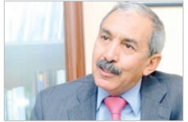
بقلم: محمد بو عزرارة

خلال تسعينيات القرن الماضي كتبتُ مقالاً في مجلة «الشاشة الصغيرة» التابعة لمؤسسة التلفزيون التي كنتُ أتولى إدارتها بعنوان :