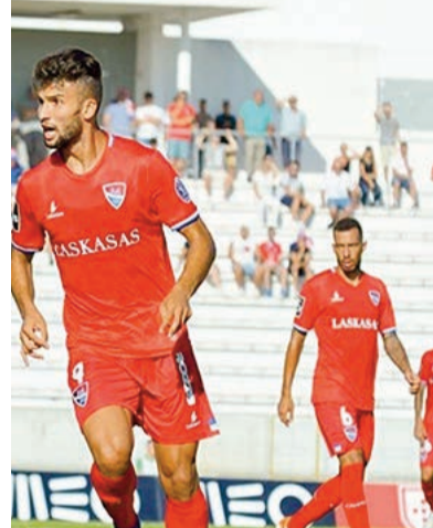
لفريق ينافس على الألقاب ويشارك في المنافسات القارية.

ورفض نعيجي، بحسب بعض المصادر، العودة من جديد إلى نادي بارادو، حيث أكد للمسؤول الأول عن هذا الفريق، أنه في حال عاد إلى الرابطة الأولى، فإنه يرغب في اللعب