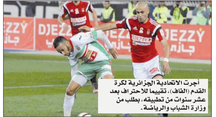
أجرت الاتحادية الجزائرية لكرة القدم (الفاف)، تقييماً للإحتراف بعد عشر سنوات من تطبيقه، بطلب من وزارة الشباب والرياضة.

علمت «واج» من الهيئة الفيدرالية أن وزارة الرياضة طلبت من «الفاف» توضيح الرؤية أكثر حول الإحتراف. ومنذ تجسيده على أرض الواقع في سنة 2010، في عهد رئيس الفاف السابق محمد روراوة، تعرض الإحتراف إلى انتقادات لاذعة، حيث اعتبر بعض مسؤولي الأندية