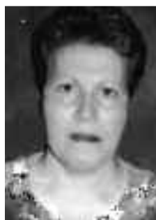
بفضل ما يحملها رجالها ونساءها من قيم الشرف والعزة والألفة. في تلك الملحمة لم يكن

البحث عن المال والجاه، وإنما الهدف المنشود أكبر كبر هذا الوطن وعظمة شعبه ويتمثل في استرجاع السيادة الوطنية وانتزاع الحرية من قبضة استعمار بغيض لا يتورع في ممارسة أبشع ألوان التعذيب والنهب. لم يكن أيامها ممكنا المرور عبر كبريات شوارع الجزائر العاصمة. وتتأسف اليوم لتخلي الإنسان الجزائري عن تلك القيم التي حملها في ظل الفقر والاستعمار، وتقل لماذا تخلينا عن الأخوة العميقة والأصالة والنضال الجماعي وكلها قيم نبيلة سقطت أمام سطوة الأناثية وطغيان المال والشهرة المزيفة. وعن مكانة التاريخ اليوم في الضمير والحياة اليومية، أجابت