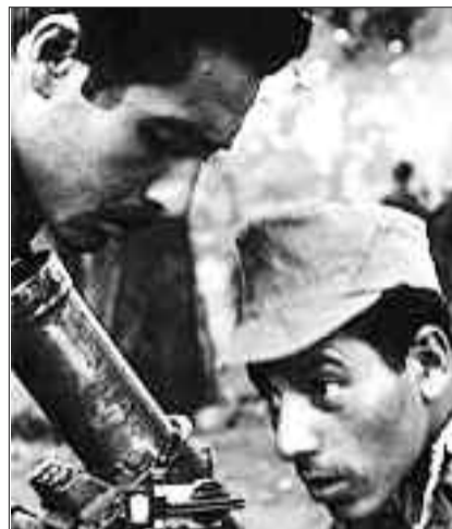
لقد تم تهريب أكثر من ألف مجاهد من الحدود الغربية.

ولكن المشكل بقي في كيفية الاتصال بقادة الثورة، وكان لنا ذلك عن طريق بعض ممن تم نفيهم إلى المغرب، ودخلنا بأسلحتنا والتحقنا بالجيال وكان أنذاك لم تقم المناطق والنواحي بل كانت القطاعات، وكانت أول منطقة التحقت بها هي قرية تاندرارة بولاية تلمسان ثم تم نقلنا إلى منطقة افلو بولاية الأغواط بالقعدة، حيث بقينا نكافح الاستعمار الغاشم لمدة سبعة أشهر، ليتم تحويلنا إلى تيارت لكوننا من المنطقة ومنها تم تقربنا من ذونا مما زادنا إصرارا على مكافحة الفرنسيين، وقبلها كانت أشهر معركة شاركت فيها هي معركة القعدة التي بدنا فيها الاستعمار خسائر جسيمة ازدادت فيها شراسته، مما أدى به إلى التكتيل بالشعب الأزل، وحيث تم القبض على العديد من الجنود الفرنسيين وغنمنا 75 قطعة سلاح وكان قائدنا بلحاج بوسيف في تلك المعركة الذي تعلمنا منه أيجديات مياعة المستعمر، ثم انتقلنا إلى البيض بعد اشتداد الخناق علينا وكان للمواطنين دور فعال في انتقالنا، وتذكرت