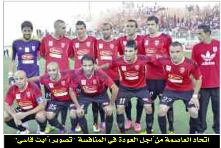
اتحاد العاصمة من أجل العودة في المنافسة

وتحقيق نتيجة سلبية في «الداربي» سيغير إدارة حداد على التضحية برأس قاموندي لامتناس غضب الأنصار وهو ما لن يرضى به هذا الأخير ولهذا السبب قام بنقل تدريبات الفريق إلى ملحق 05 جويلية الأولمبي لإبعاد اللاعبين عن الضغط والتضخيم النفسي لهذه المباراة ومعروف عن قاموندي أنه يعرف جيدا كيف يحضر لاعبيه من الناحية النفسية للمباريات الصعبة أما فنيا فمن المتوقع أن يقوم بإجراء بعض التغييرات على التشكيلة الأساسية كإقحام الحراس ضيف مكان زماموش الذي كان بعيدا عن مستواه خلال الجولتين الأولى والثانية حتى أن الأنصار حملوه مسؤوليية التعادل أمام «السنافر» وخسارة العلة كما سيصح قاموندي الشاقي سقار وقاسمي لتتشيط هجوم الفريق مع الاعتماد على يوشامة وكودري في الاسترجاع.