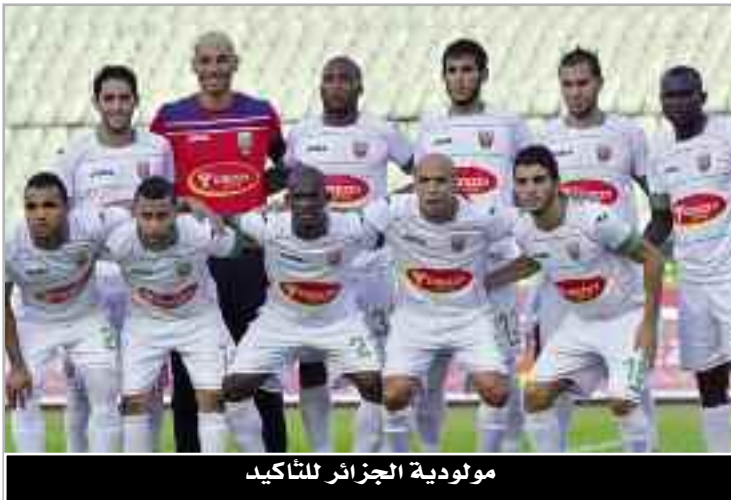
مولودية الجزائر للتأكيد

علمهم المسبق لصعوبة المأمورية. أما شبيبة القبائل فسيصافرون إلى بشار لمواجهة شبيبة الساورة ومن المتوقع أن يواجه أشبال فابرو صعوبات كبيرة خلال هذه المواجهة بعد الوجه الطيب الذي ظهر به الفريق المضيف رغم خسارته في المقابلتين الأولتين.