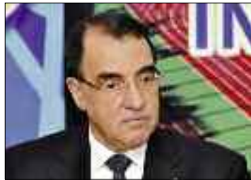
بالرياضة الجزائرية وتشريف ألوان الوطنية في المحافل الدولية.

طالب الوزير رؤساء بعض الاتحادات الذين طرحوا أمامه انشغالاتهم إلى السعي لإيجاد الحلول وتقديم الاقتراحات لأنهم الأدرى بمشاكلهم وسيتلقون الدعم اللازم داعيا إلى العودة إلى الإطار القانوني من أجل المشاكل وقال أن مهمة هيئته هي الدعم والمرافقة وليس المراقبة، وأضاف أنه يجب تقوية عمل الجمعيات العامة لكل عضو فيها محاسبة المسؤول على النتائج المحققة ويجب النظر إلى الأمر من زاوية موضوعية تدخل على الحرص على المصلحة العامة. وردا على انشغالات الاتحادات غير الأولمبية قال تهمي أن كل المشاكل المطروحة شرعية لكن هناك هرم أولويات يجب الاستناد إليه ويجب تقديم اقتراحات معقولة ومقبولة وستحصل على دعم الدولة.